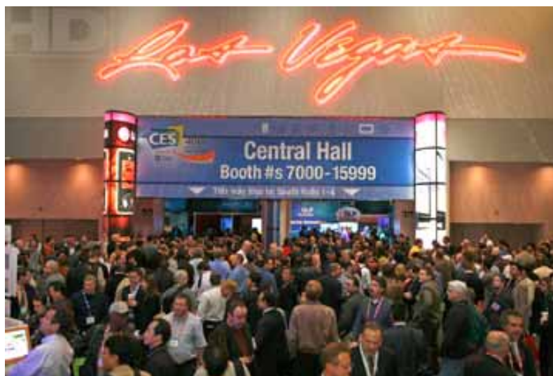
会場入り口の様子

CES(Consumer Electronics Show) は CEA(Consumer Electronics Association) : 全米家電協会が 1967 年から毎年開催している世界最大の家電・情報通信・エレクトロニクスに関する総合展示会であり、今年はちょうど 40 周年にあたる。毎年 CES では各メーカーがこぞって新製品を発表する場でもあり、今回もいくつも話題を呼ぶ製品が発表されていた。